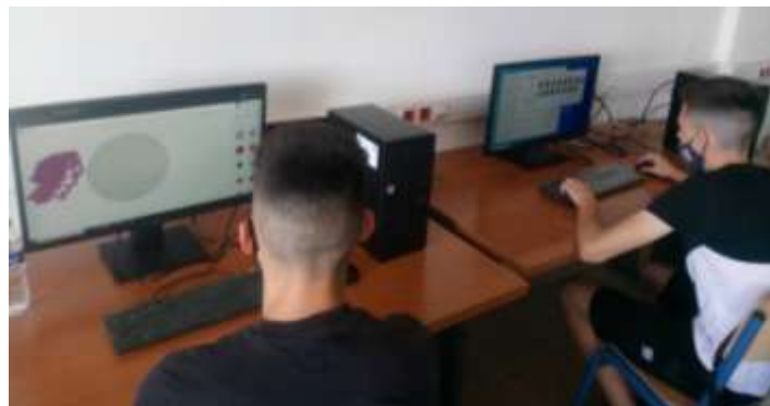
Φωτογραφία 5. Μοντελοποίηση νομισμάτων από τη Χάρτα του Ρήγα