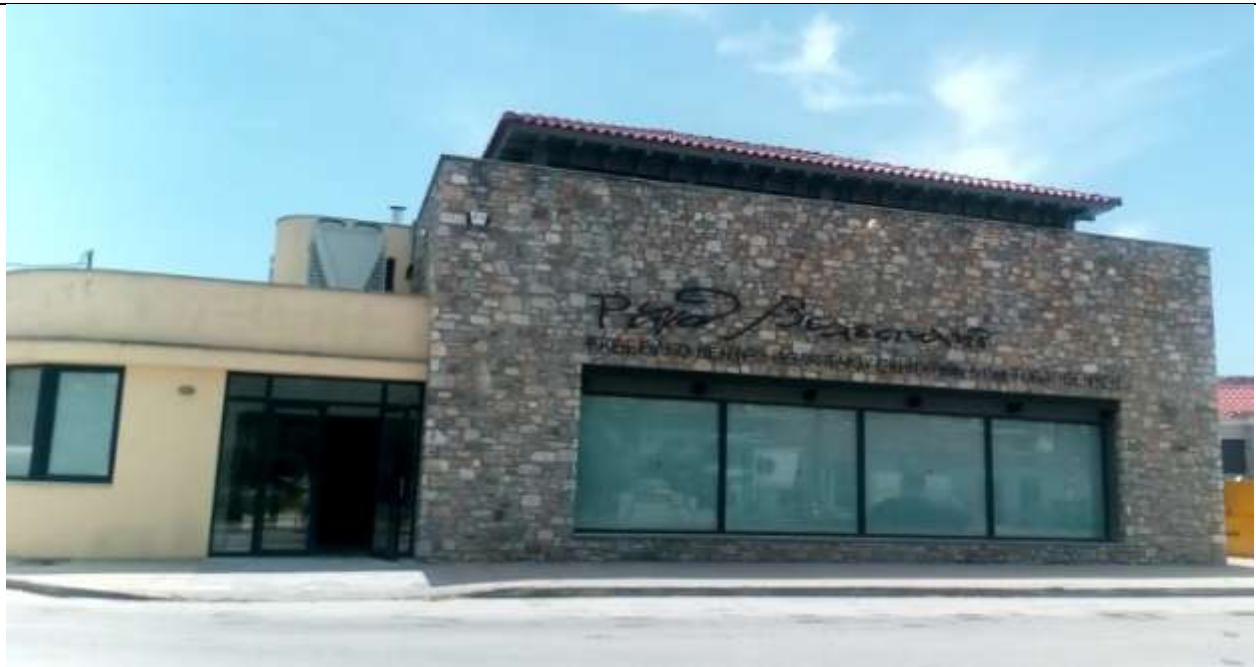
Φωτογραφία 8. Πολιτιστικό κέντρο 'Ρήγας Βελεστινλής' πριν την αρχιτεκτονική παρέμβαση