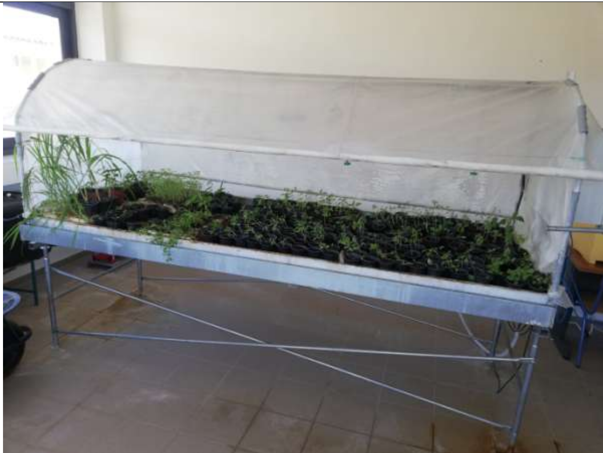
Φωτογραφία 7. Ριζοβολία των μοσχευμάτων στον πάγκο ριζοβολίας