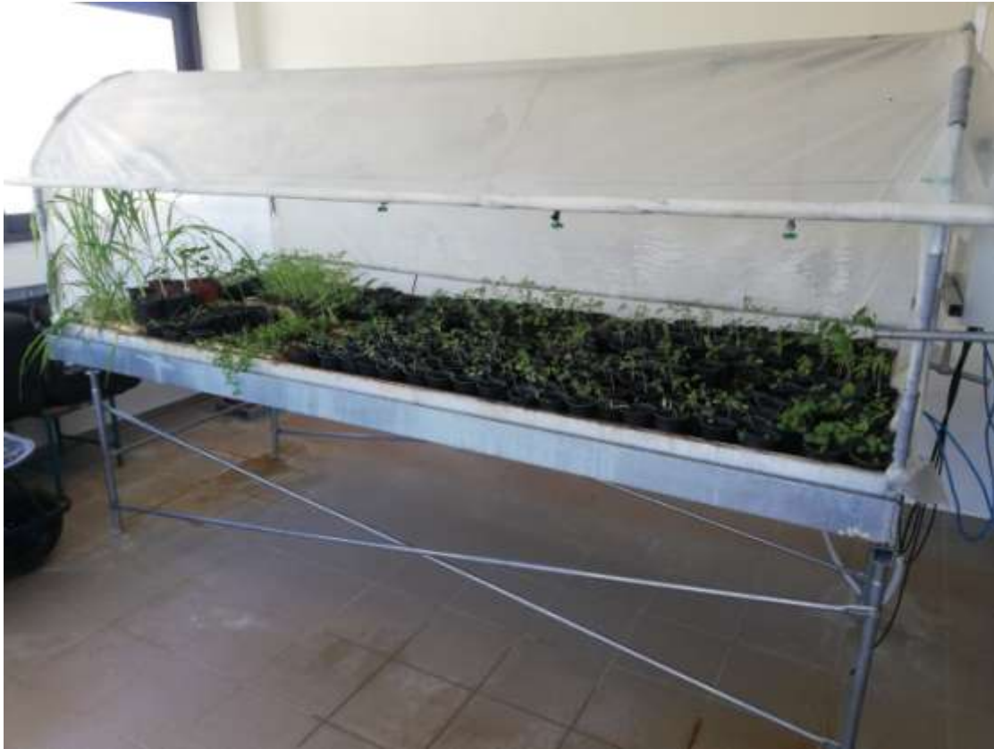
Φωτογραφία 6. Φύτρωμα ανθοκομικών φυτών

Οι μαθητές του τομέα Γεωπονίας, Τροφίμων και Περιβάλλοντος (Β' και Γ' τάξεων) προσέφεραν καλλιεργητικές φροντίδες στα νεαρά φυτά σε συνεργασία με τους μαθητές της Α' τάξης. Λόγω της πανδημίας και των διακοπών του Πάσχα, οι μαθητές περιορίστηκαν στην ανάπτυξη των ανθοκομικών φυτών εντός του πάγκου υδρονέφωσης (φωτ 6) και στην ριζοβολία των ανθοκομικών και αρωματικών φυτών (φωτ 7)